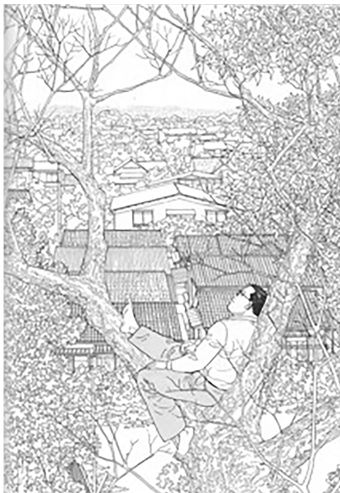
« ARUKU HITO » © PAPIER/Jiro TANIGUCHI par l'intermédiaire du BCF